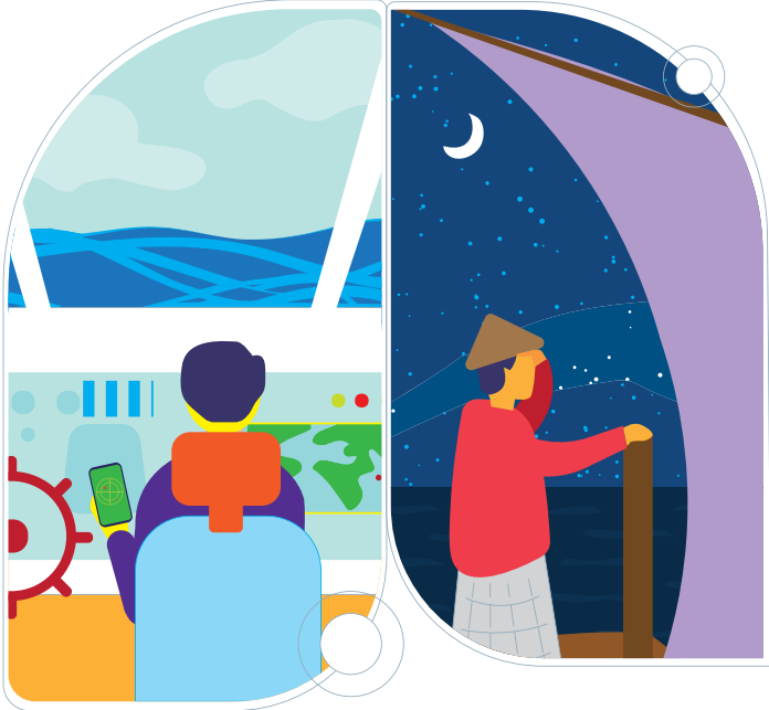
Every Maldivian employee must be paid MVR 3,000/- as Ramazan Allowance, before the beginning of the month of Ramazan.

މި އަހަރުގެ ރަމަދާނު ខަލީފާ 2020 ގައި ދިވެހި މަސައްކަތްކުރާ ބައްލަވާލައްވާ ފަރާތްތަކަށް 3,000/- ރުފިޔާގެ ރަމަދާނު ފުރިހަމަކުރުމުގެ ބޭނުންކުރާ ލަންޓު ދެއްވާ ނިންމުން ނެގި ފަދަ ގޮތެއް ހަދާ ނެގި ނެތް ގޮތެއް ނެތެވެ.